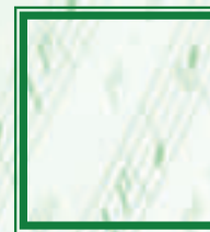
A CONFIRMAR Prof. de oboe